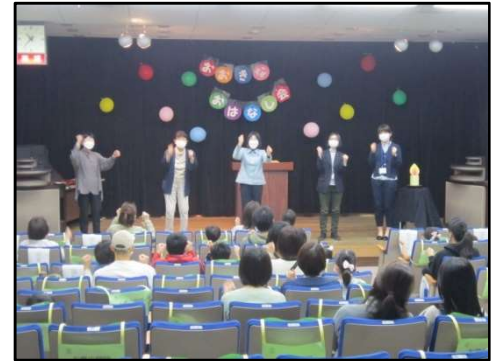
令和5年度おおきなおはなし会の様子です