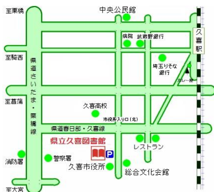
— 埼玉県立久喜図書館アクセス地図 —

編集・発行 埼玉県立久喜図書館 〒346-8506 久喜市下早見 85-5 電話 0480-21-2659(代表)