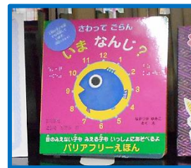
点字の絵本 『さわってごらん いまなんじ?』 (中塚裕美子/さく・え 岩崎書店 1999)

まるちめでいあ でいじー ろくおんとしよ でいじー えるえる ぶっく マルチメディア デイジー、 録音図書 デイジー、 LL ブック、