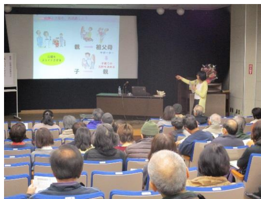
2017年度開催 「孫・パパ・ママの応援団になろう！ "孫育て"で、笑顔のセカンドライフ」講演会より