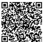
健康・医療情報 サービス