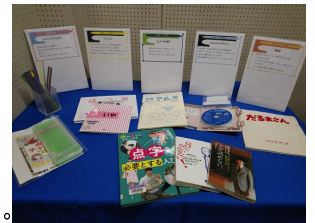
バリアフリー資料セットの一例

https://www.lib.pref.saitama.jp/guidance/spnd/post-2.html