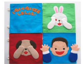
布絵本 『いないいないばあ しましょう!』 のぐちみつよ / 〔作〕