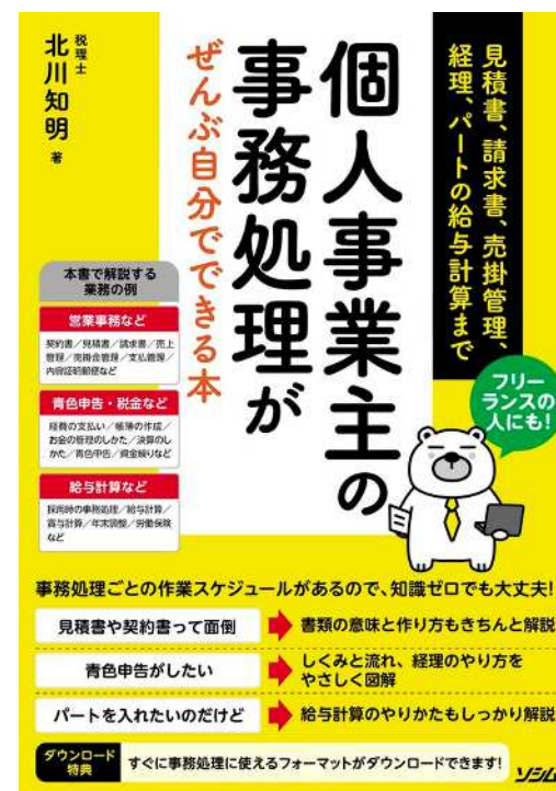
336.9/コシ 『個人事業主の事務処理がぜんぶ自分でできる本』 (北川知明著 ソシム 2021)