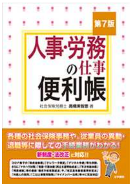
336.4/シ 『人事・労務の仕事便利帳 第7版』 (高橋美智恵著 法学書院 2020)