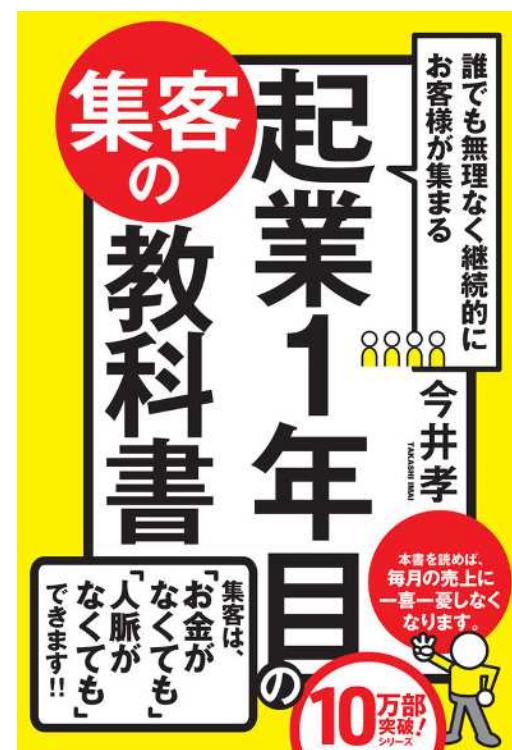
335/外『誰でも無理なく継続的にお客様が集まる 起業1年目の集客の教科書』 (今井孝著 かんき出版 2019)