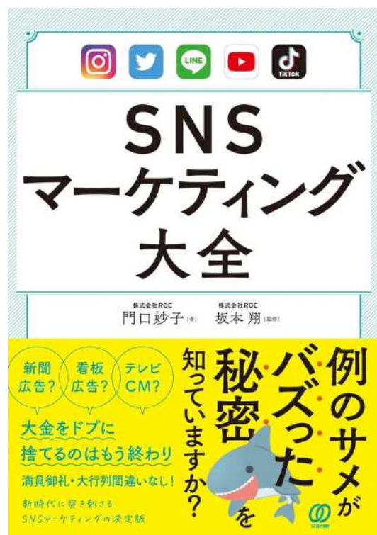
675/エス『SNSマーケティング大全』 (門口妙子著・坂本翔監修 ぱる出版 2022)