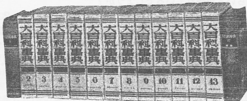
日本最初の事典「世界大百科事典」 平凡社

百科事典的なものには、古くは『和名類聚抄』(注1)や『和漢三才図会』(注2)などがあり、明治時代になって『故事類苑』(注3)全100巻が刊行されました。第二次世界大戦のさなか書かれた『明治事物起源』(注4)も百科全書的性格を持った書物といえます。