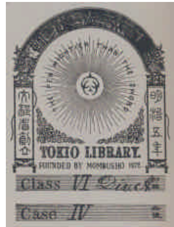
東京書籍館の蔵書票

一方、実はその28年前の明治5(1872)年、西洋の蔵書票かと見紛うようなデザインの蔵書票が日本に現れていました。現在の国立国会図書館の前身に当たる東京書籍館が上野に創立された際、蔵書に貼付されたものがそれです。図面中央の放射線状のデザイン周縁には、英語で“THE PEN MIGHTIER THAN THE SWORD”(ペンは剣よりも強し)と記されています。この銅版画を西洋の影響を受けていない純日本産の蔵書票と考えるのには無理がありますが、大衆に広まるよりはるか前のこの蔵書票が、おそらくは日本における西洋風蔵書票の走りなのでしょう。