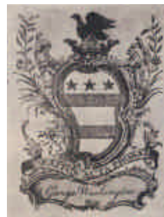
ジョージ・ワシントンの蔵書票

1445年にグーテンベルクによって活版印刷術が発明されたことで、愛書家や図書館などの蔵書が増加し、それにもなって蔵書票の需要も増大することになります。蔵書票はその後、全ヨーロッパにかなり早い速度で広がりを見せ、それから少し遅れて、新大陸のアメリカへと伝えられました。