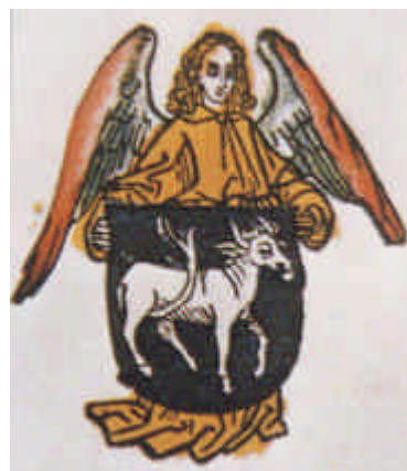
ブックスハイム修道院に残る蔵書票