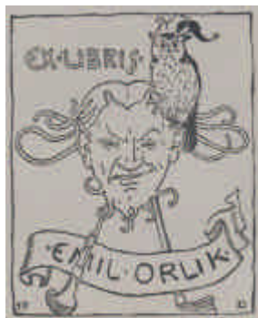
エミール・オルリックの蔵書票

日本に古くは蔵書票がなかったのかというと、実はそうでもなく、印刷が普及しはじめた室町時代（奇しくも西洋と同じ1470年頃）、京都の醍醐寺光台院の所蔵本に蔵書票が使用されていたことが知られています。ただし、これには文様や絵はなく文字だけを印刷した実用的なものでした。