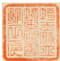
【埼玉県立図書館の蔵書印】

日本での蔵書印の歴史は古く、最初の使用については諸説あるようですが、奈良時代に作られた光明皇后の「積善藤家」の印が、現存する我が国最古の蔵書印だといわれています。これは光明皇后の御筆と伝えられている『杜家立成雑書要略（とかりっせいざっしょようりやく）』という書物に押印されています。