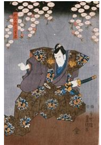
芝居絵「壇浦兜軍記(3枚続きのうち中央部分)(重忠)」 嵐山史跡の博物館蔵

この小テーマでは、重忠ゆかりの史跡である「菅谷館跡」を中心に、重忠の史跡・遺物に関する資料を展示しています。