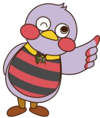
埼玉県のマスコット さいたまっち