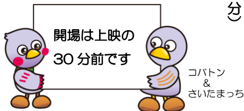
コバトン & さいたまっち