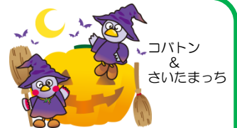
コバトン & さいたまっち

開館時間 火～金 9:00～19:00 土・日・祝日 9:00～17:00 子ども図書室 9:00～17:00 障害者サービス ■ は休館日、○ は祝日開館日です