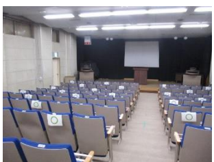
▲視聴覚ホール内の様子 新型コロナウイルス感染症対策として、座席の間隔をあけています。