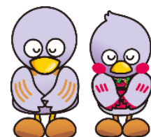
コバトン&amp;さいたまっち

令和2年は、当館が登録したレファレンス事例へのアクセス数が、約300万件に上りました。データ登録件数・アクセス数ともに、データベース事業に大きく貢献したことから、13年連続で国立国会図書館からお礼状をいただきました。