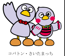
コバトン・さいたまっち

「県民の日」の11月14日(月)は、開館いたします。開館時間は、午前9時から午後7時までとなります。皆様のご利用をお待ちしております。