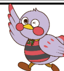
さいたまっちゃん 埼玉県のマスコット

「子ども読書の日(4月23日)」を記念して、子ども読書室内で「くまのパディントンとロンドンのおはなし」をテーマに資料展示を行います。今年はイギリスの児童文学『くまのパディントン』が誕生して60周年になります。ぜひ足を運んでみてください。