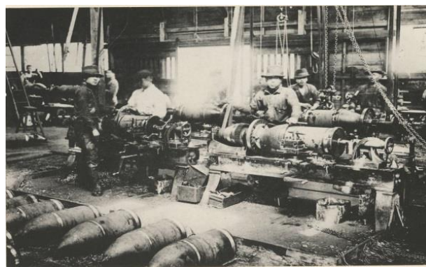
川口鋳物工場（『大正十年埼玉県写真帖』より）