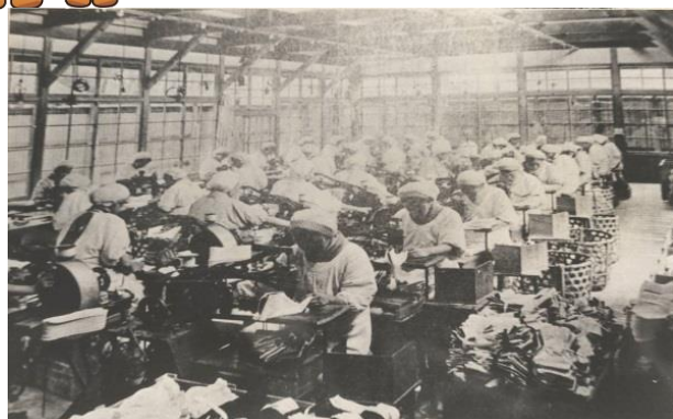
行田足袋工場（『昭和九年埼玉県写真帖』より）