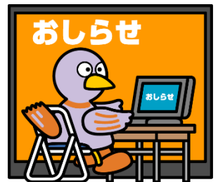
埼玉県のマスコット コパトン