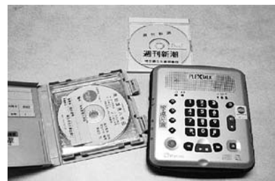
DAISY 図書・雑誌、再生機

DAISY は章・節・項の頭出しや読みたいページへのジャンプなどができるとても便利な録音図書です。久喜図書館では再生機の操作説明も行っています。