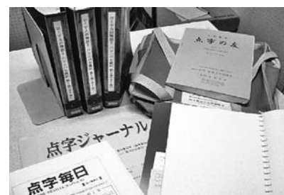
点字図書・点字雑誌

ご利用になる場合は、利用の3日前までに電話などによる予約が必要です。(ご予約・詳しい内容につきましては、下記、県立久喜図書館障害者サービス担当までお問い合わせください。)