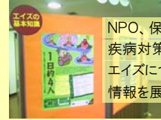
NPO、保健所、県の 疾病対策課と連携し、 エイズについて幅広く 情報を展示

県立図書館ウェブサイトにも、展示の様子や関係する資料(本)のリストを掲載しています。