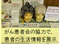
がん患者会の協力で、 患者の生活情報を展示

企画展 これだけは知っておきたい！ HIV/AIDS 平成25年11月～12月に実施しました。