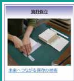
ウェブサイトトップページまたはQRコードからどうぞ！

壊れちゃった本、どうしてますか？ 本の構造から材料・道具、基本的な修理方法まで、「そこが知りたい」が満載！ わかりやすいイラスト付きで、11種、館内で配布してます！