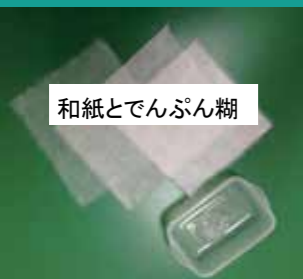
和紙とでんぷん糊

修理をする場合でも、原形(オリジナル)を尊重し、安全な材料(でんぷん糊と和紙)を使って、可逆性(元に戻せる修理)を心がけて修理を行います。