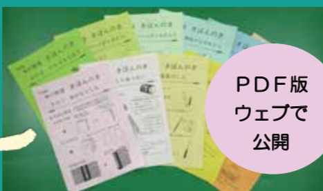
PDF版 ウェブで 公開