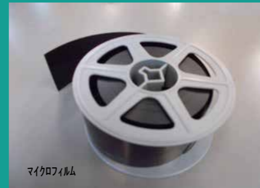
マイクロフィルム

県立図書館では、新聞の全国紙の地域面、いわゆる「埼玉版」の原紙を製本して保存しています。