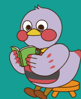
埼玉県マスコット「さいたまっちゃん」