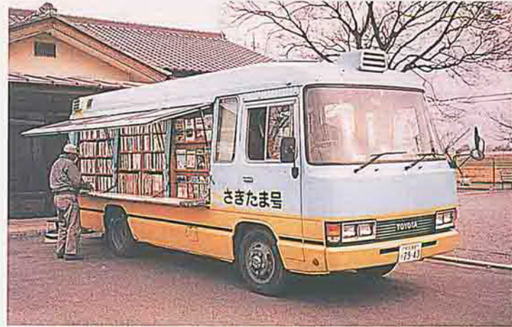
▲移動図書館車“さきたま号”