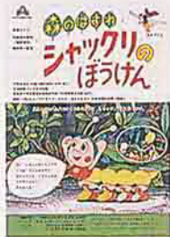
森のはずれシャックリのぼうけん