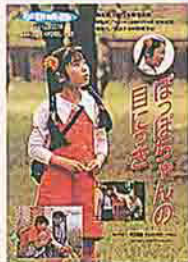
ぼっぼちゃんの目につき

ぼっぼちゃんという明るく元気いっぱいの子を通して、障害児教育のありかたを考えます。