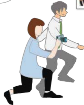
街を歩き情報収集・写真撮影