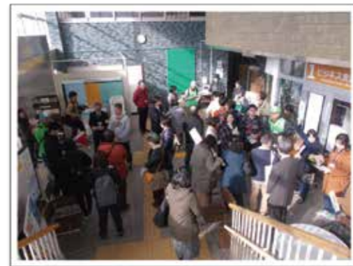
図書館に集合し街歩きスタート!