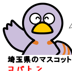
埼玉県のマスコット コバトン

ミュージカル映画の「雨に唄えば」やシニカルな笑いを誘うコメディ「笑う故郷」を上映するよ♪