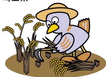
埼玉県マスコット 「コバトン」