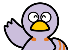
埼玉県のマスコット