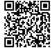
埼玉県立図書館 ウェブサイト二次元コード