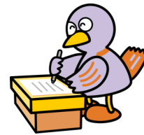
埼玉県マスコット 「コバトン」