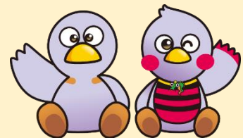
埼玉県マスコット コバトン&さいたまっち