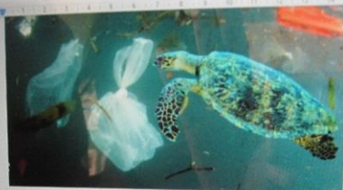
1 プラスチックを食べてしまった動物

クラゲと間違えてプラスチックを食べてしてしまう。地上で、最も大きい動物のアフリカゾウのおすの平均体重が約7トンだから、毎日130万頭のアフリカゾウと同じくらいのプラスチック製品が作られていることになります。