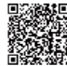
埼玉県立図書館ウェブサイト 健康・医療情報 QR コード