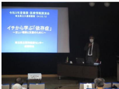
健康・医療情報講演会 2022.3 「イチから学ぶ『依存症』」