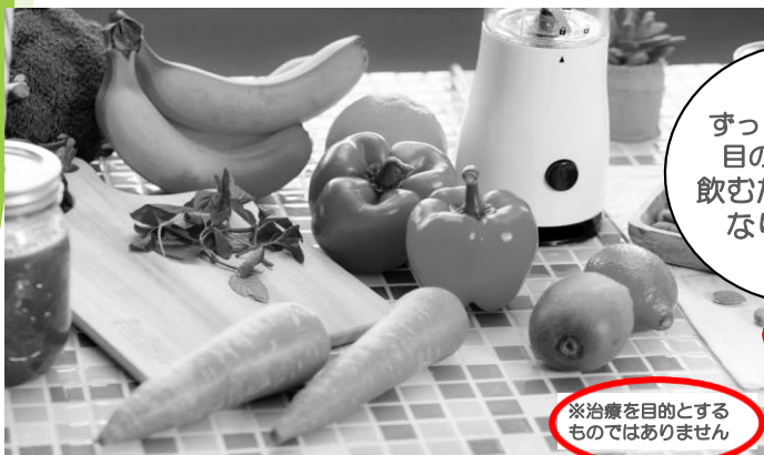
※治療を目的とする ものではありません