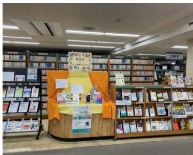
資料展 2022.3-5 「依存症を正しく理解するために」