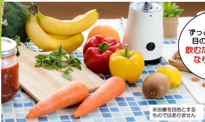
※治療を目的とする ものではありません