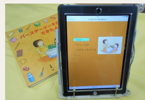
マルチメディアデジナーの資料