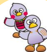
埼玉県マスコット コバトン&さいたまっち