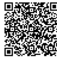
健康・医療情報 サービス

〒346-8506 埼玉県久喜市下早見 85-5 電話 0480-21-2659(代表) F A X 0480-21-2791 https://www.lib.pref.saitama.jp/