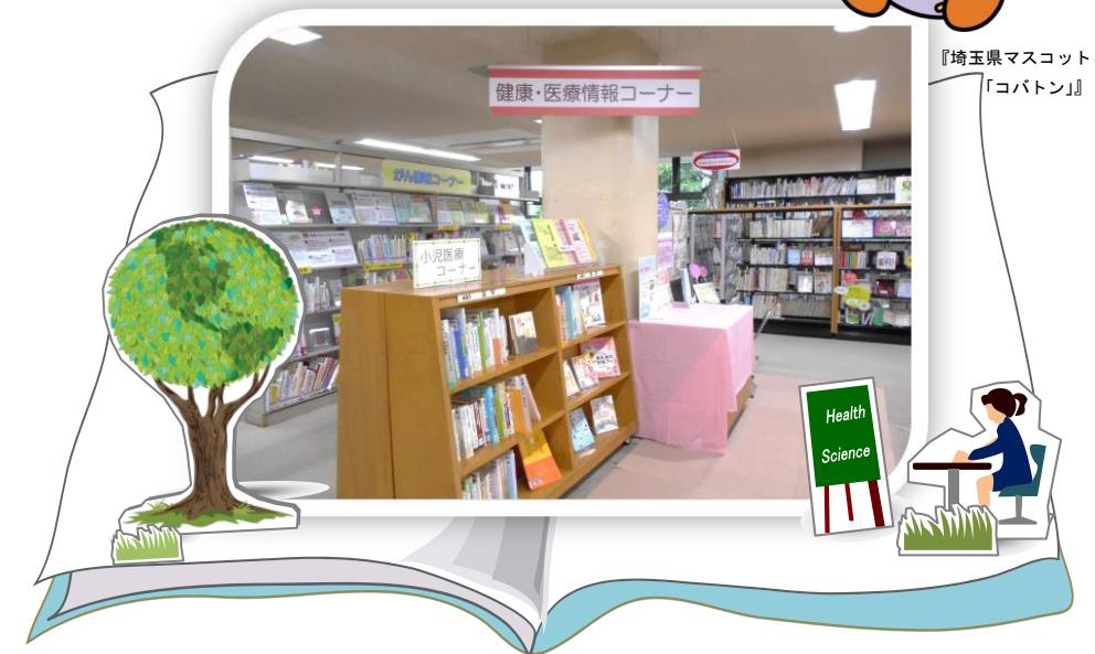
『埼玉県マスコット 「コバトン」』

ご自身の病気や飲んでいる薬、ご自分やご家族の健康管理について、自ら情報を調べて判断したい、という方が増えています。