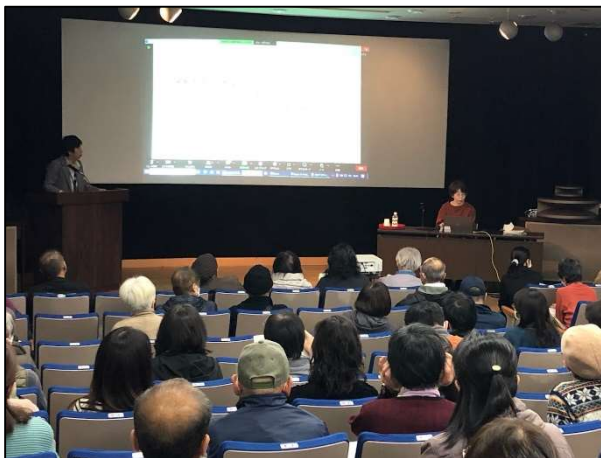
令和5年度健康・医療情報講演会 「耳と心の不思議な関係」