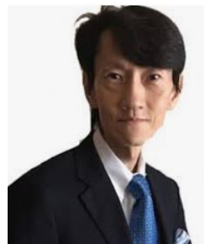
(講師プロフィール)

長年にわたり、理学療法士としてリハビリテーション医療に従事。健康教室、介護教室、転倒予防教室などで講師を務める。