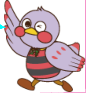
埼玉県マスコット「さいたまもち」