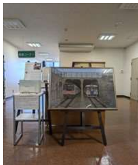
障害者アート（福島尚氏「むさしの号・リレー号すれちがい（大宮一浦和間）」）