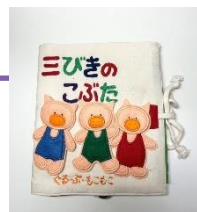
布絵本「三びきのこぶた」