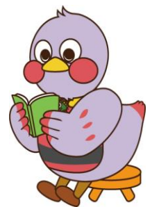
埼玉県のマスコット「さいたまっちゃん」

〒330-0063 埼玉県さいたま市浦和区高砂 4-3-18 TEL 048-844-6165 FAX 048-844-6166 ウェブサイト https://www.lib.pref.saitama.jp/