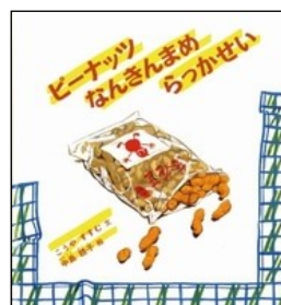
『ピーナッツ なんきんまめ らっかせい』