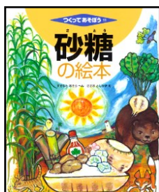
さとう 『砂糖の絵本』