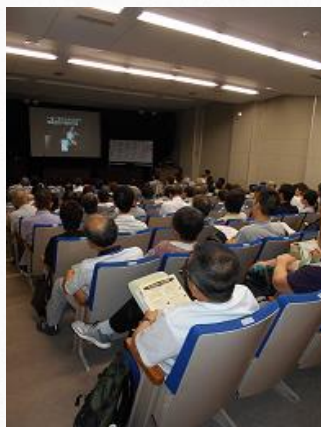
★「がん患者の体験談を聴く」講演会