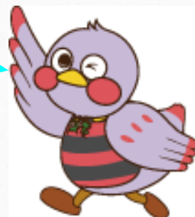
埼玉県マスコット「さいたまもち」