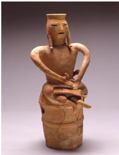
写真：行田市埼玉古墳群・瓦塚古墳出土『琴を弾く男性埴輪』 埼玉県立さきたま史跡の博物館蔵

家・人物・馬・鳥・・・、さまざまな形の埴輪はもともと古墳に置かれたものです。墓を飾る絵画や造形をまとめて「墓葬芸術」と言いますが、それは古代の中国や朝鮮半島でも流行しました。埴輪を古代東アジアの墓葬芸術と比較し、墓である古墳になぜ埴輪を立てるようになったのか、考えてみたいと思います。