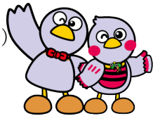
コバトン・さいたまっちゃん

<入場無料/事前申込みが必要です。10月15日(木)から電話又はインターネットで受付開始>