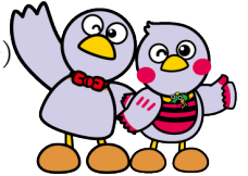
コバトン・さいたまっちゃん

<入場無料/事前申込みが必要です。10月15日(木)から電話又はインターネットで受付開始>