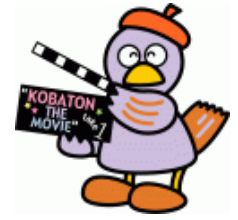
埼玉県のマスコット コバトン