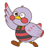
埼玉県のマスコット さいたまっち

「子ども読書の日（4月23日）」を記念して、平成29年4月29日（土）から平成29年5月7日（日）まで、子ども読書室内にて「シリーズ完結記念！『こそあどの森の物語』～岡田淳の世界～（仮）」をテーマに資料展示を行います。