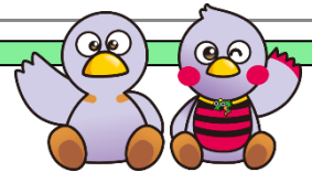
コバトン・さいたまっち

なお、10月2日(月)から10月6日(金)までは秋期特別整理期間のため休館します。