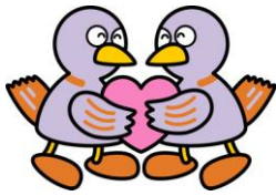
埼玉県のマスコット コハトン