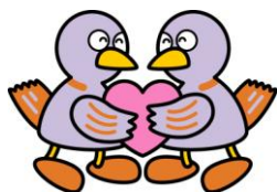
埼玉県のマスコット コハトン