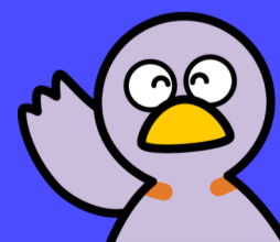
埼玉県のマスコット 「コバトン」